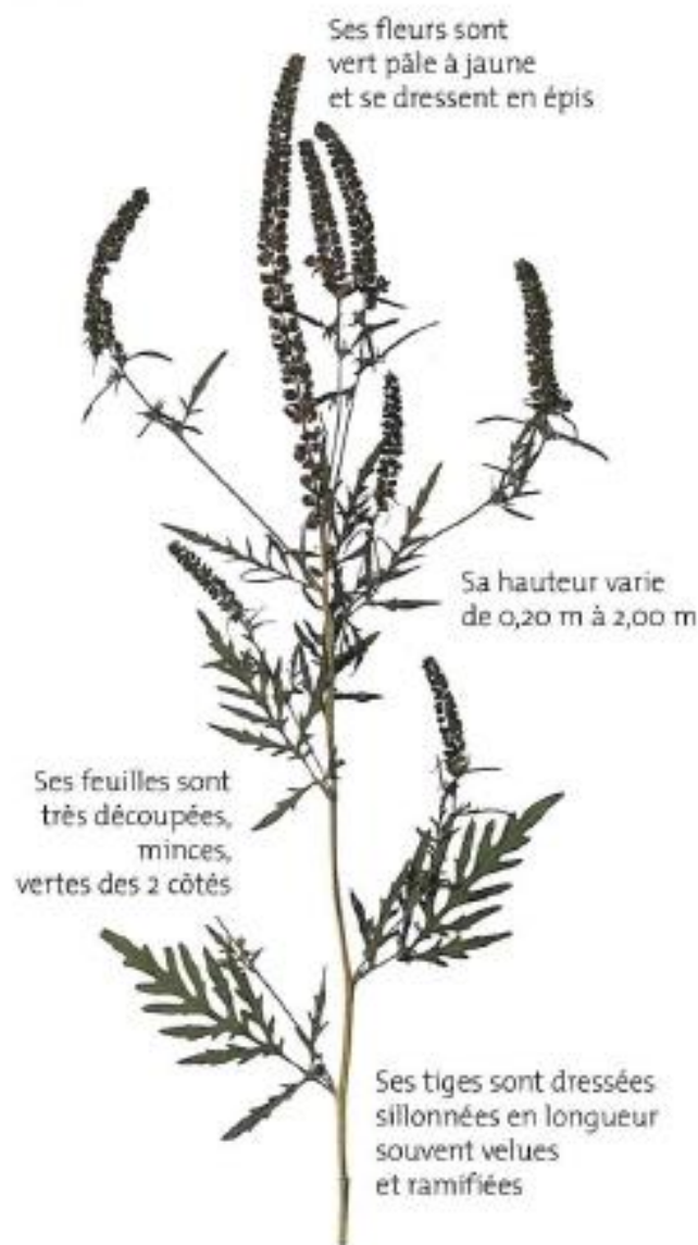
AMBROISIE EN FLEUR