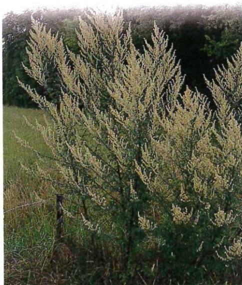
ARMOISE VULGAIRE EN FLEUR

Observatoire des ambrosies, d'après DDAS Rhône