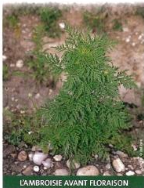
L'AMBROISIE AVANT FLORAISON