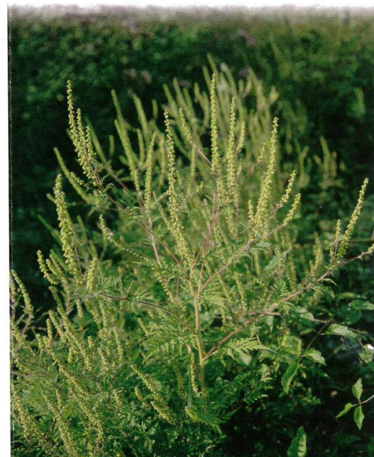
AMBROISIE A FEUILLES D'ARMOISE